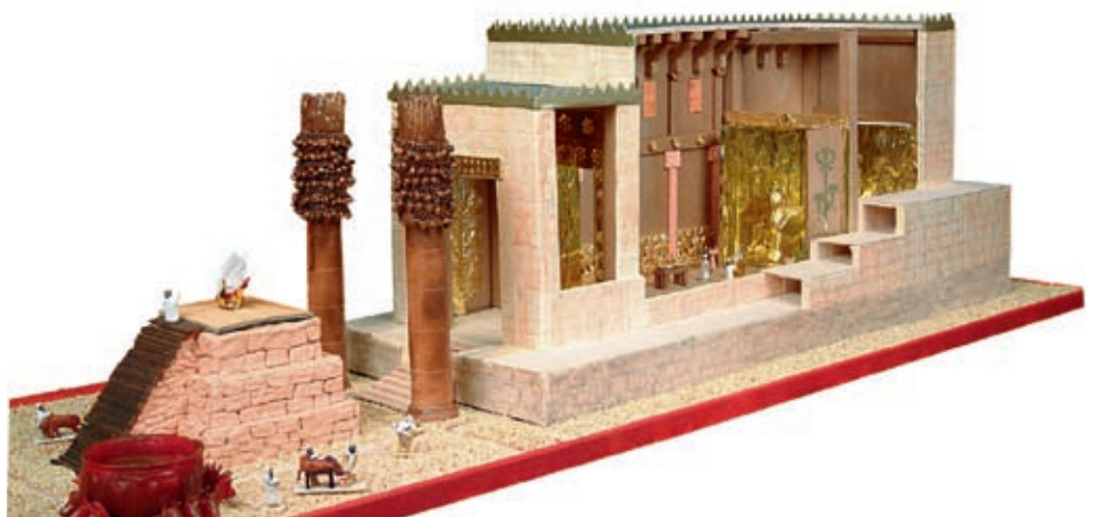
Modell des Salomonischen Tempels

Fast jeder Mensch stellt sich im Laufe seines Lebens wohl einmal die eine oder andere der folgenden Fragen: «Was bin ich? Wer bin ich? Woher komme ich? Wozu bin ich hier? Wohin gehe ich?» Jede Zeit hat Antworten auf solche Fragen gesucht. Oft taten dies Denker, Gläubige und Mystiker alleine oder in der Gemeinschaft von philosophischen Zirkeln, religiösen Gruppierungen und Mysterienbünden.